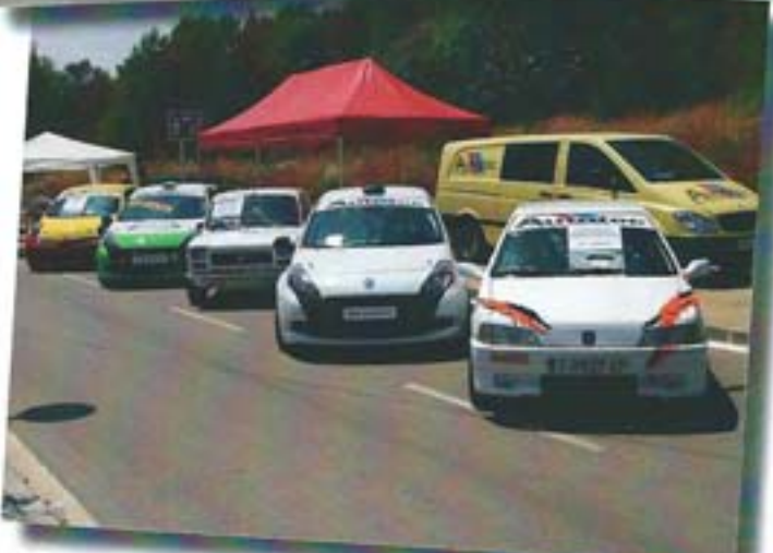
En Canyelles se pueden contemplar coches nuevos, seminuevos, clásicos... hasta militares.