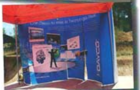
Dayco ha colaborado en la V Fira del Motor de Canyelles.